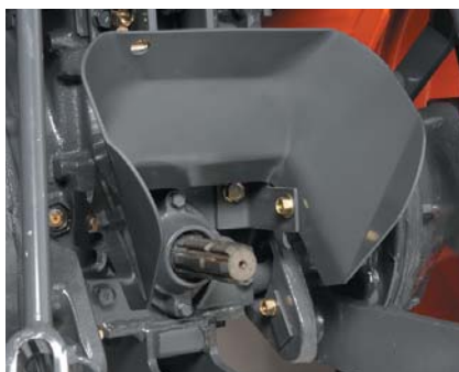
Protector de la TDF

Con el L4100 puede accionar la toma de fuerza hidráulica e independiente sin usar el embrague y de forma muy fácil. Accionar la TDF estacionaria es tan fácil como bajarse del asiento. También dispone de protector de la TDF abatible, soporte del brazo superior del enganche tripuntal y estabilizadores telescópicos.