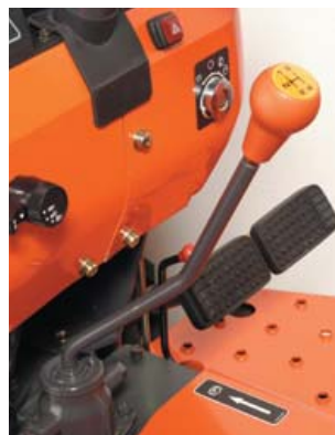
Palanca de cambio principal (L3200)