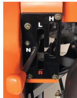
Palanca de cambio de gamas